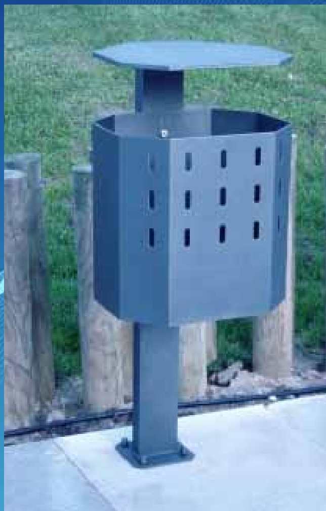
Papeleira PC05 (400x370x1008 mm)