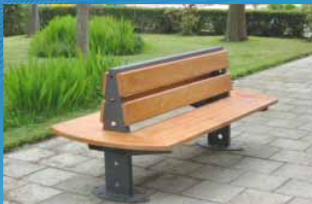
■ Banco BC05 (2000x1000x450 mm)