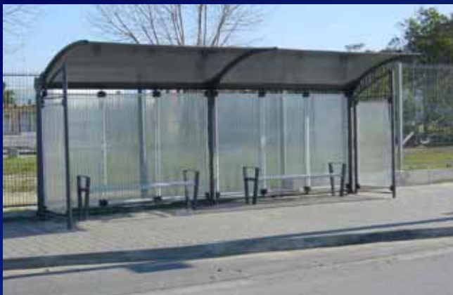
Paragem de Autocarro PAC01