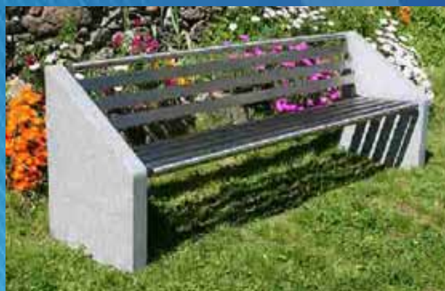
■ Banco BS04 (1720x600x800 mm)