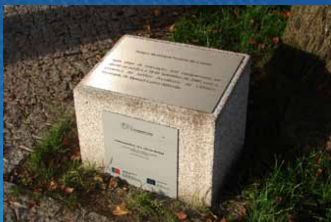
Placa de inauguração (gravação laser)