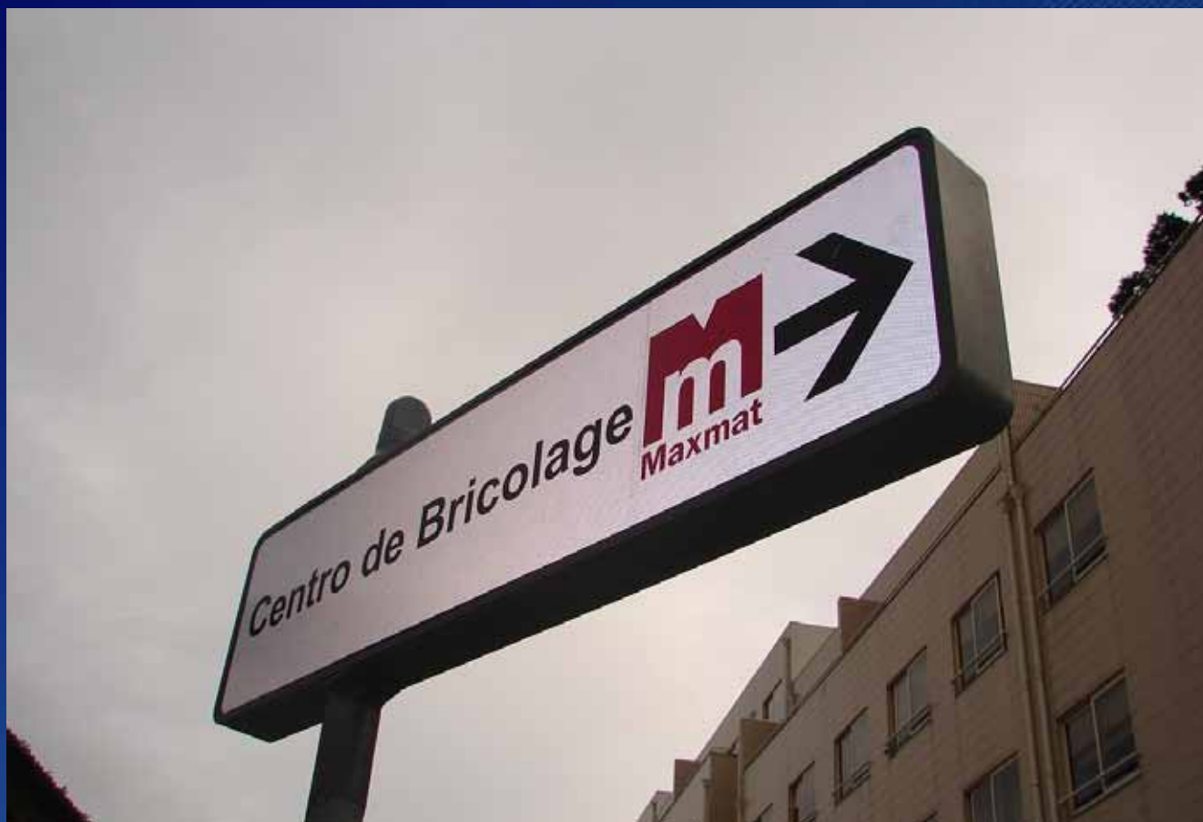
Setas Comerciais de Indicação (160 x 40 cm)

A Reclacambra tem diversas estruturas de setas comerciais por todo o país ao dispor do seu negócio.