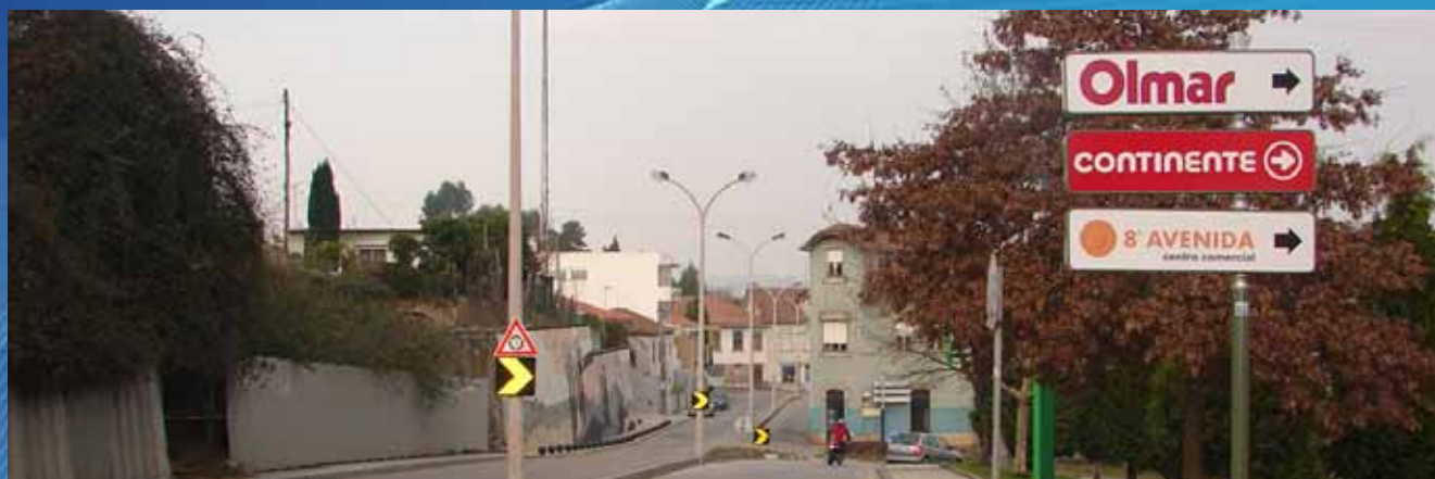
Setas Comerciais de Indicação (160 x 40 cm)