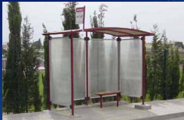
Paragem de Autocarro PAC02