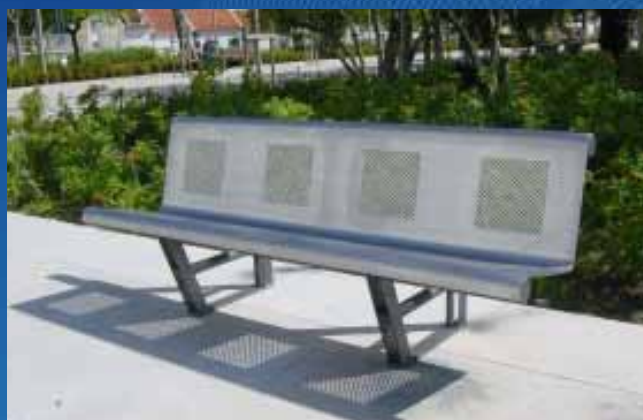
■ Banco BC03 (2000x640x780 mm)