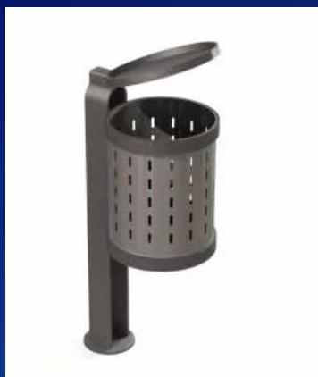
Papeleira PC02 (400x505x1280 mm)