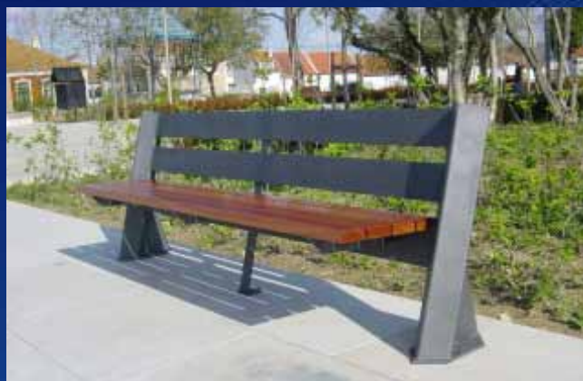
■ Banco BC01 (1800x554x736 mm)

Se não tivermos o que necessita, não se preocupe... nós criamos e responderemos ao seu pedido.