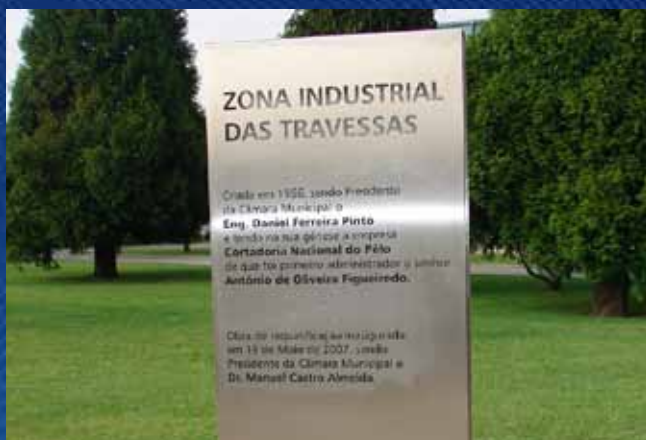
Placa comemorativa (corte e gravação laser)