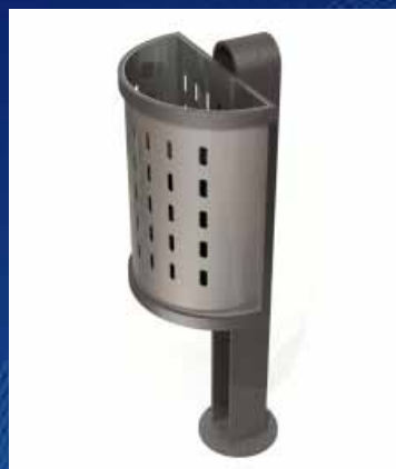
Papeleira PC03 (400x310x1050 mm)