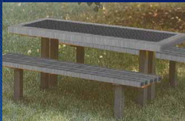
■ Banco Corrido com Mesa MBS01 (1800x1600x800 mm)