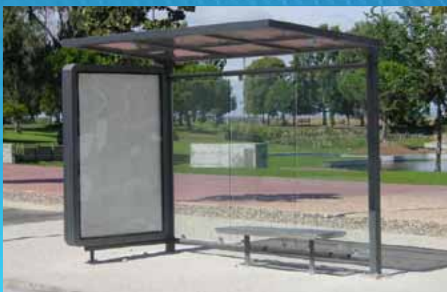
Paragem de autocarro PAC04