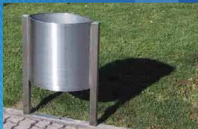
■ Papeleira PS03 (500x300x800 mm)