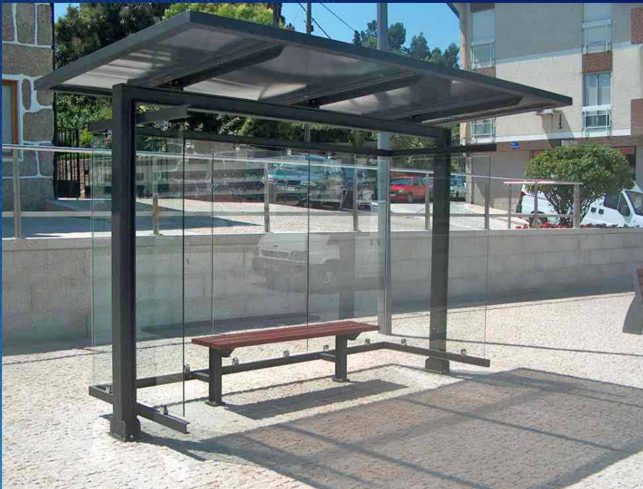
Paragem de autocarro PAC03