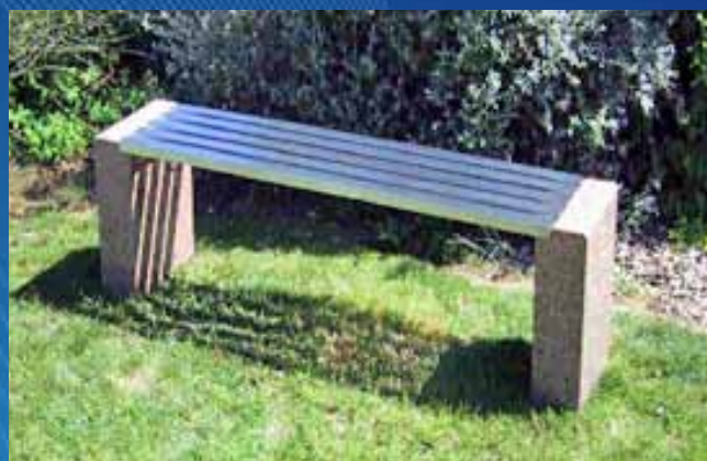
■ Banco BS02 (1710x365x450 mm)