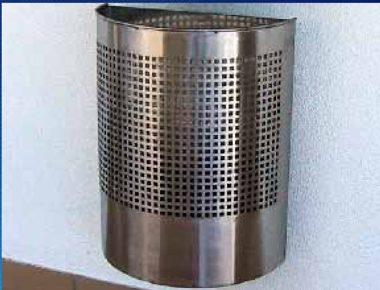
■ Papeleira PS01 (400x230x500 mm)