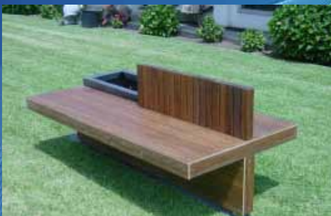
■ Banco BC04 (1800x900x740 mm)