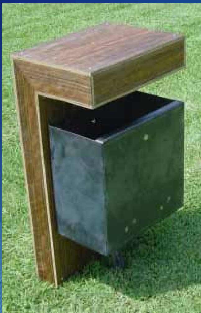
Papeleira PC04 (400x300x750 mm)