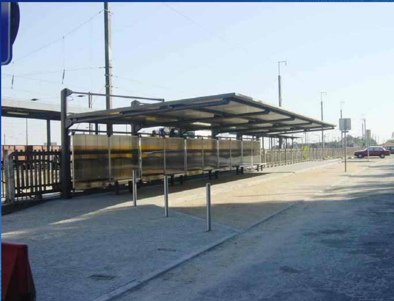
Abrigo Taxis AC01