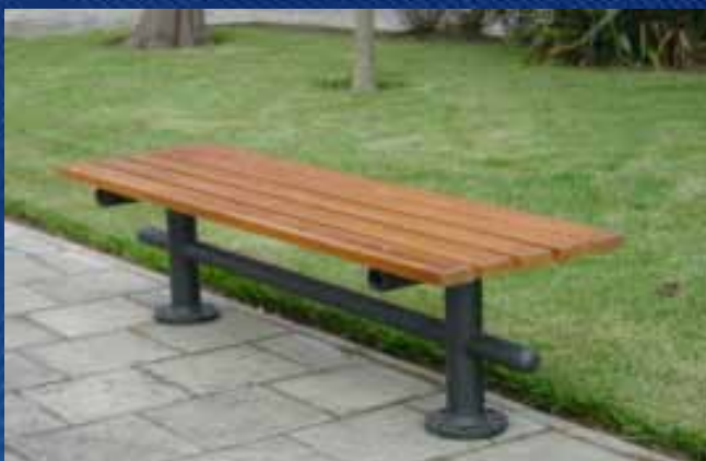
■ Banco BC06 (1800x530x450 mm)