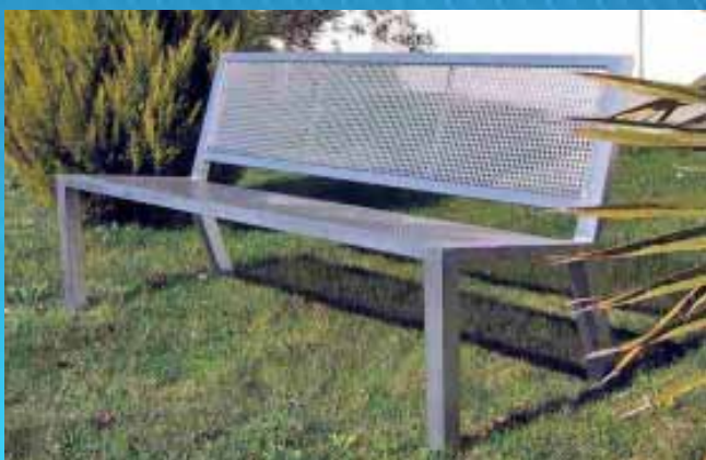
■ Banco BS03 (1175x645x785 mm)