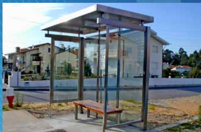
Paragem de autocarro PR01