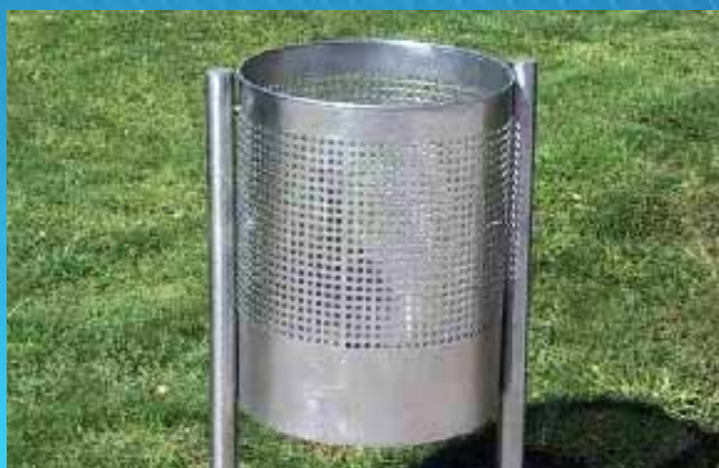
■ Papeleira PS02 (500x500x750 mm)