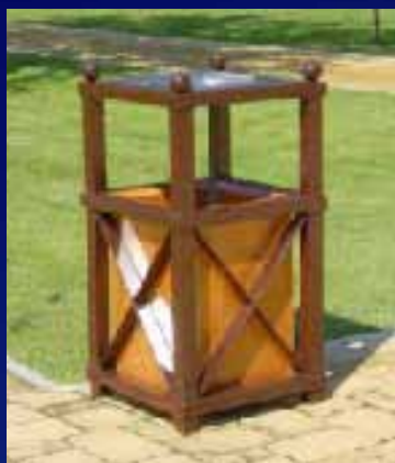
Papeleira PC01 (530x530x970 mm)