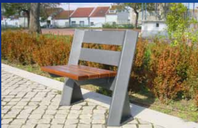
■ Banco BC02 (500x554x736 mm)