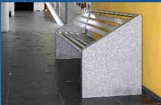
■ Banco BS01 (1720x600x800 mm)